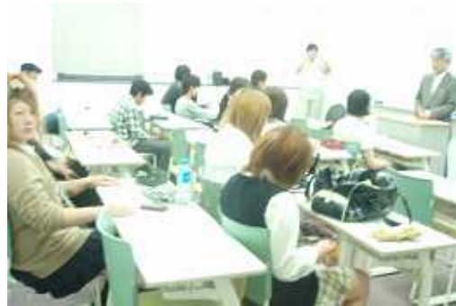
駿台スクーリングの様子

レポート・授業時間終了次第 夏休み 火・水・木は検定対策講座などを行う予定です。