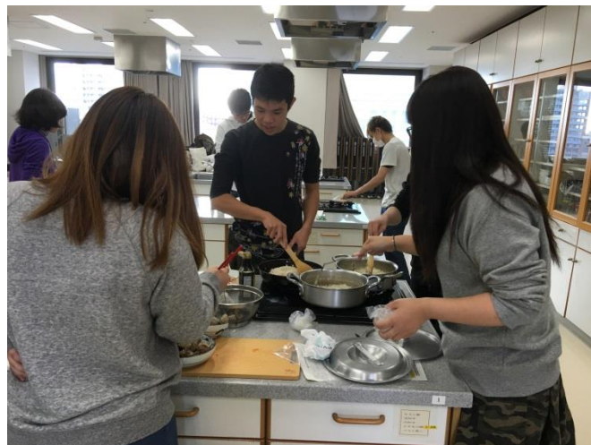
↑ 去年の家庭科調理実習の様子