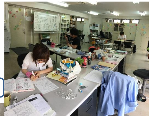
← ↑ レポート学習の様子

レポートの③・④枚目、放送視聴②枚目が提出範囲です。期限までに提出できるように、がんばりましょう