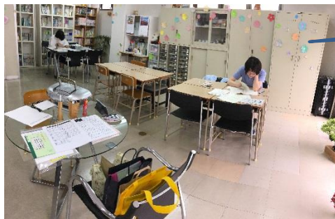
校外模試受験の様子

それぞれ、好きな場所で、レポート締切に向けて、頑張ってレポートに取り組んでいます。