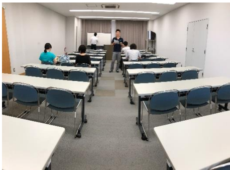
7月スクーリングの様子

今年の夏は、かなりの猛暑で熱中症で体調を 崩す人が多く出ています。夏は外での活動も 多くあると思いますが、くれぐれも無理しない よう、各自気をつけてお過ごしください。